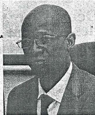
Ph. Lambert O.