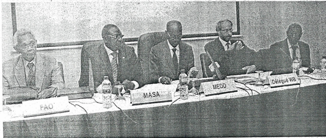
Le présidium de la cérémonie d'ouverture